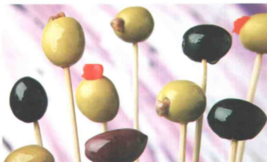
La ración media recomendada es de siete aceitunas al día

E sta organización ha lanzado la campaña con el objetivo principal de informar a los consumidores sobre los beneficios que tiene este producto, tan arraigado en la tradición gastronómica española pero del que el consumidor, a menudo, desconoce las ventajas. La aceituna de mesa tiene, entre otras propiedades, un gran contenido en ácido oleico y es una fuente importante de fibra, además de su riqueza en minerales y vitaminas.